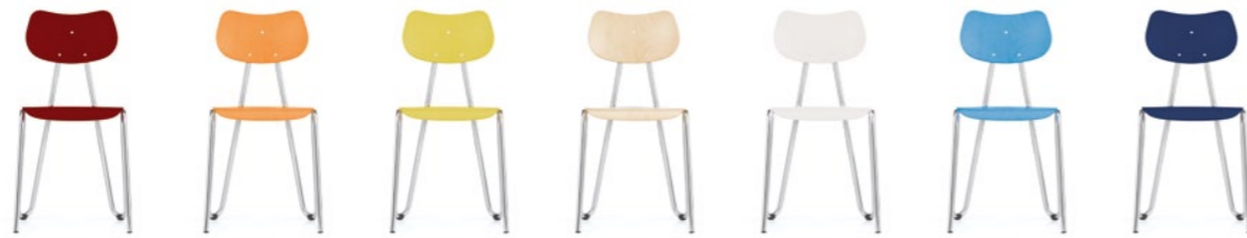
arno ist in 8 schönen Beiztönen erhältlich und eröffnet damit vielfältige Optionen in der Farbgestaltung.