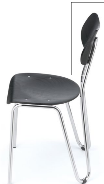
Ein besonderes ergonomisches Merkmal des arno Stuhles ist seine federnde Rückenlehne, die für einen überraschenden Sitzkomfort sorgt.